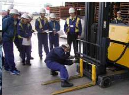
<安全講習・指差点呼等>