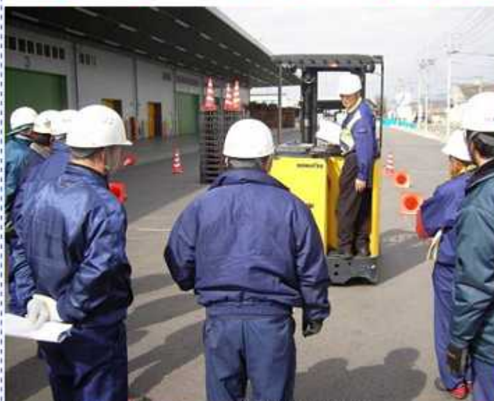
<点検ポイントの指導>