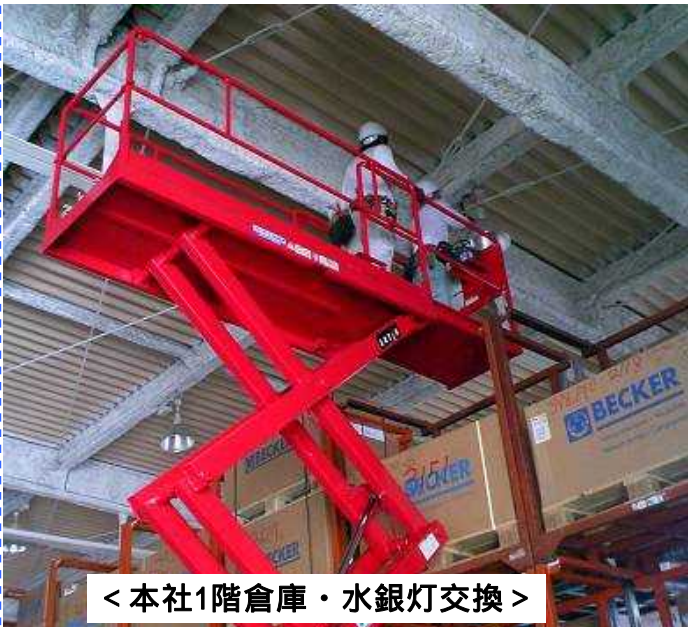
< 本社1階倉庫・水銀灯交換 >