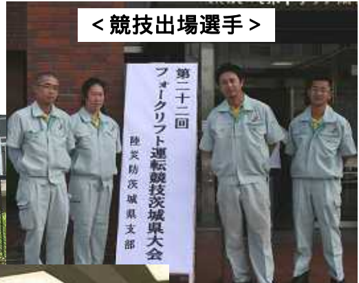
< 競技出場選手 >