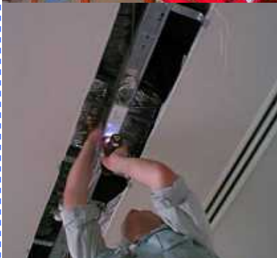
< 本社会議室・器具交換 >