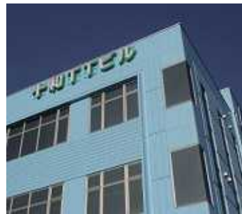
< 十和運送本社ビル >