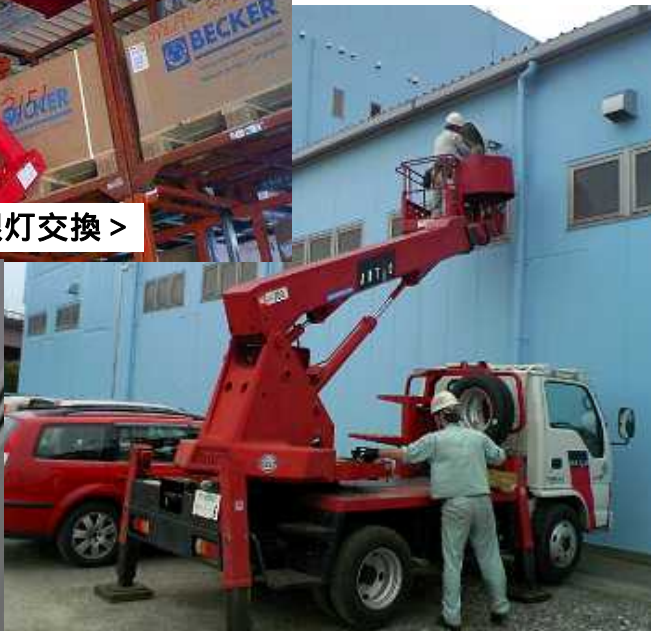
< 本社駐車場側・外壁灯交換 >