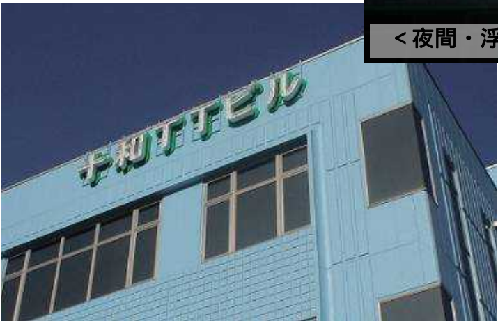
<昼間・ブルー社屋に映える白&緑の文字>