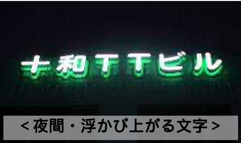
<夜間・浮かび上がる文字>