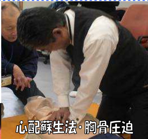
心配蘇生法・胸骨圧迫