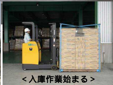
< 入庫作業始まる >