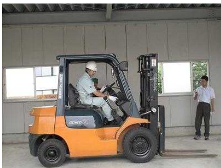
< 18年度コンテスト風景 >

平成19年6月末現在、東芝ライテック & 和光電気様対応の新物流センターが、完成しました。延べ面積3600坪を擁し、業務の開始を待っています。6月下旬から和光電気様からの貨物の入荷が一部始まり、今後8月の中旬までには、全ての準備が整います。