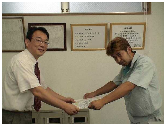
< 表彰者伝達式の様子 >

平成19年6月28日、陸上貨物運送事業労働災害防止協会の常総分会は、管轄区域内の事業所において、長年に亘り勤務に精励し災害防止に貢献した人の表彰を行いました。