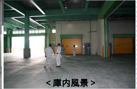
< 庫内風景 >