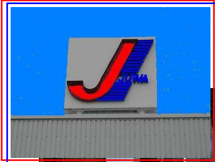
水海道支店谷和原センター運営スタッフ