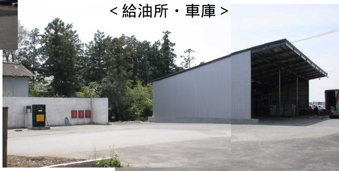
< 給油所・車庫 >

平成18年2月より水海道支店・新事務所業務は開始されています。以後旧支店跡地の整理が進み、4月より写真の通り、整備されました。燃料給油のスペースも格段に広がり、車両の往来もスムーズになりました。水海道支店の乗務員はもちろんのこと、当該給油所を利用される他支店の乗務員も安全には十分留意をしてご利用ください。なお、給油所前でのUターンは禁止されていますのでご注意ください。