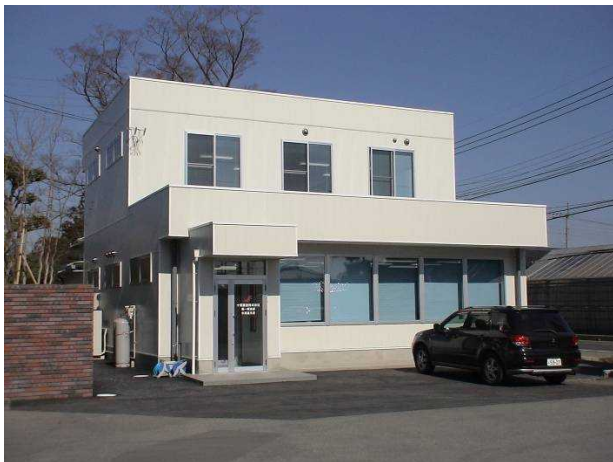
< 水海道支店 >