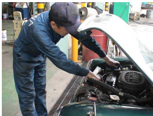
< 十和自工・点検作業 >