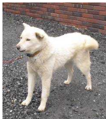
< シロ >

平成18年2月より水海道支店・新事務所業務は開始されています。以後旧支店跡地の整理が進み、4月より写真の通り、整備されました。燃料給油のスペースも格段に広がり、車両の往来もスムーズになりました。水海道支店の乗務員はもちろんのこと、当該給油所を利用される他支店の乗務員も安全には十分留意をしてご利用ください。なお、給油所前でのUターンは禁止されていますのでご注意ください。